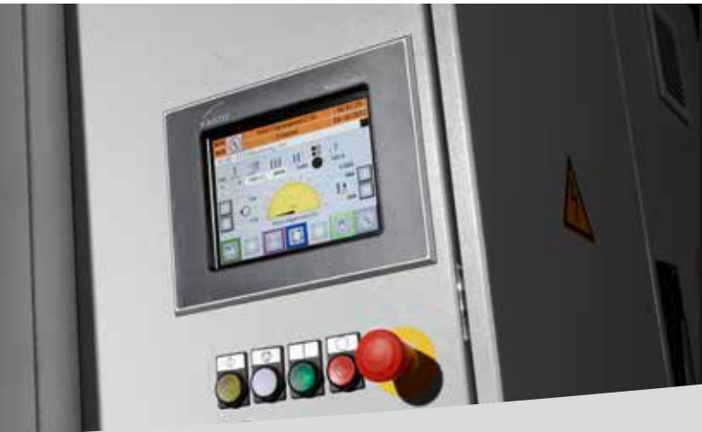
Touch Screen KASTO BasicControl.